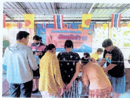
โครงการอนุรักษ์และฟื้นฟูคุณภาพน้ำห้วยจรเข้มาก